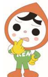
人権イメージキャラクター 人 KEN まる君

Don't worry alone. Consult with us first.