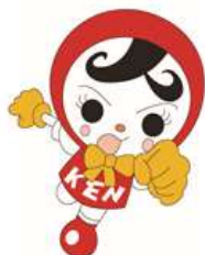
人権イメージキャラクター 人 KEN あゆみちゃん