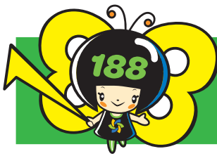
消費者庁 消費者ホットライン188 イメージキャラクターイヤマン