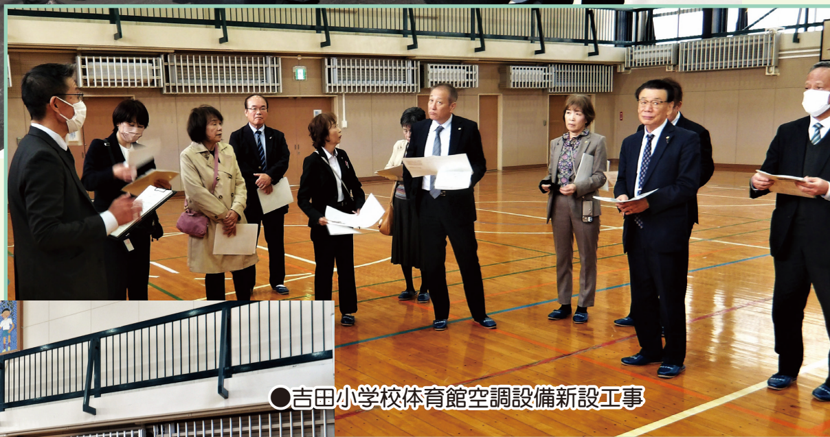
●吉田小学校体育館空調設備新設工事