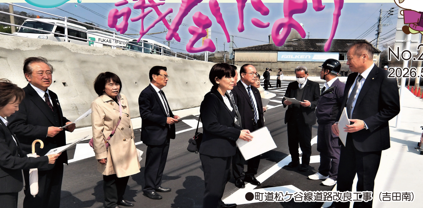
●町道松ヶ谷線道路改良工事 (吉田南)