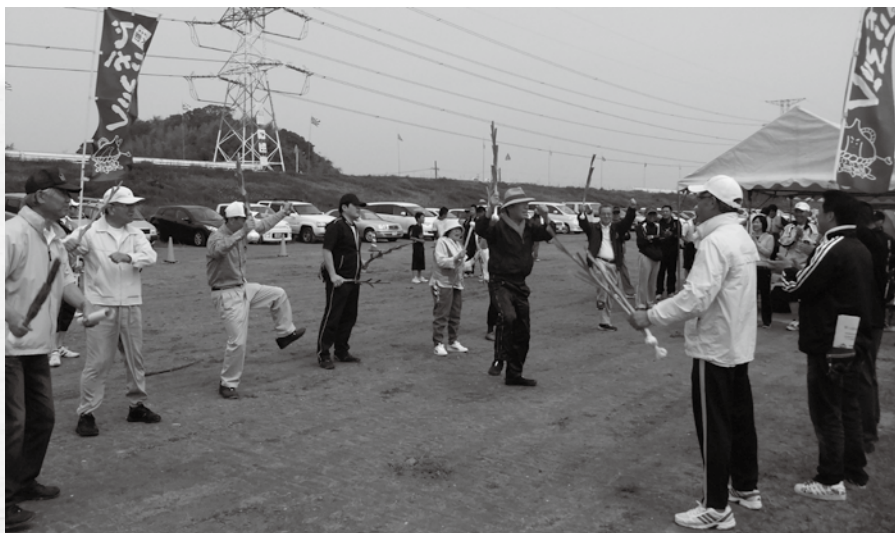
(でかんにんにく踊りで応援する水巻町議会応援団)

レガッタとは複数の人数によるボート競技のことですが、水巻町議会が参加した競技は、舵手1人、漕手4人によるものです。