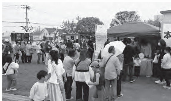
4町の笑顔が集まるマルシエ おんがぐんぐんマルシエ

九州共立大学の学生が自分たちで作成したクイズを出題すると、元気に手を挙げて答える子どもたち。「すごい、よく知ってるね」と、学生たちも驚いた様子でした。