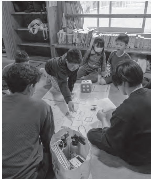
遊びながら防災を学ぼう 杵児童クラブ防災講座

4月20日、猪熊小学校3年生に人権擁護委員から人権の花であるヒマワリの種が贈られました。この活動は、栽培を通して「命の大切さ」や「人を思いやる心の大切さ」を学ぶものです。人権イメージキャラクターも登場し子どもたちは大興奮でした。