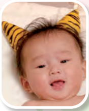
あらかし せな 荒木 汐凧くん (猪熊)