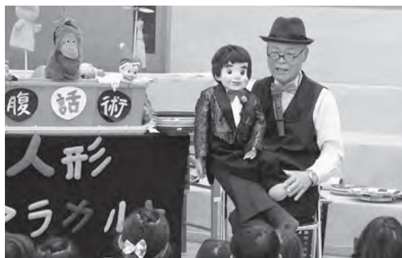
かばおじさんがやってきた！ 水巻中央幼稚園イベント

11月27日、社会福祉協議会が主催する「ふれあい活動普及講座」がいきいきほーで行われました。第3回目となる今回は「手拭いで法被をつくろう」。1枚の手拭いを折って形を作り、縫うなどしてミニサイズの法被を作っていました。講師は水巻すみれ会が担当し、参加者の「ここはどうすればいいですか」といった声に、コツを伝えたり手本を見せたりしながら教える場面も。取材に来ていた広報係にもお土産で法被をもらいました。しばらくの間、役場2階広報係窓口に飾っていますのでぜひ見に来てくださいね。