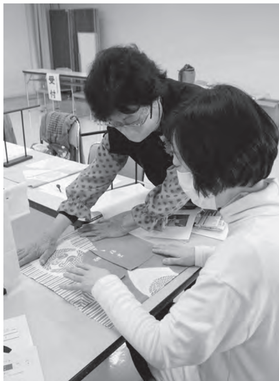
ミニサイズの飾れる法被づくり ふれあい活動普及講座

協議会では「ファミリー体力測定会」や「キッズスポーツフェスタ」などを主催し、町のスポーツ推進活動を行っています。