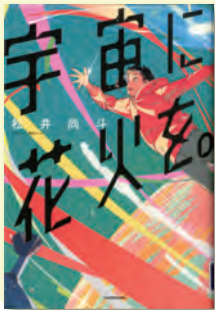
宇宙に花火を。 松井尚斗 著 / KADOKAWA