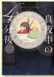
真夜中の4分後 コニー・パルムクイスト 作・堀川志野舞 訳 / 静山社