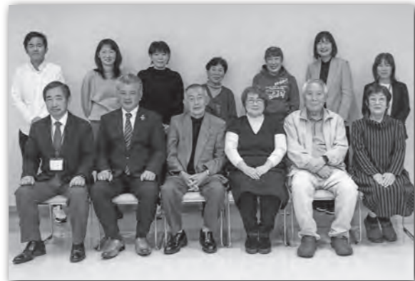
▲さまざまな立場から参加している13人の協議会委員。