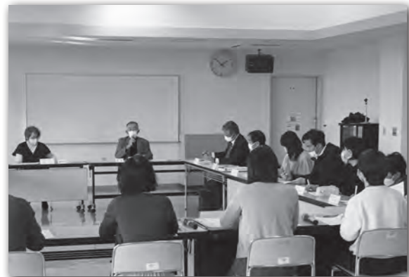
▲会議の様子。白熱した議論が繰り広げられます。