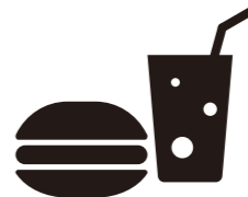
おやつは時間と 量を決めて

身近な位置に体重計を用意し、毎日体重を測るようにしましょう。「いつのまにか体重が増えていた」となることを防げます。