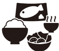
1日3食同じ時間に バランスの良い食事を

体を適度に動かすことでエネルギーが消費され、余分なエネルギーが脂肪として蓄積されなくなるので肥満の予防になります。