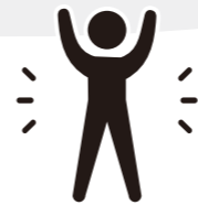
毎日30分以上 体を動かす

かむ回数が少ないと、満腹に感じるまで食べ続けてしまい食べ過ぎの原因に。野菜などは大き目に切ったり、少し固めに調理したりするとかむ回数が増えます。