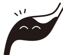
よくかんで ゆっくり食べる

おやつをだらだら食べると、次の食事がとれなくなってしまいます。おやつに高カロリーのものを選ぶ場合は、ジュースではなくお茶が水を組み合わせましょう。