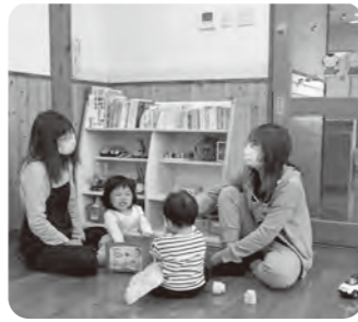
▲保護者同士の交流も!