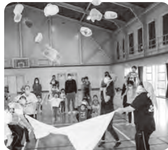
▲吉田保育園「ゆめらんど」と合同の子育てファミリー運動会