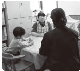
▲プライバシーが守られる個室での相談