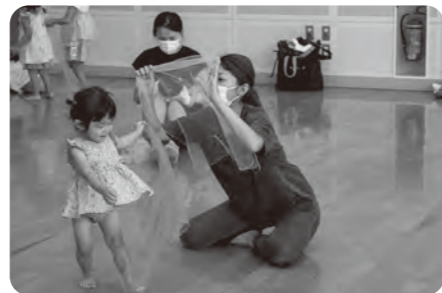
▲音楽を聞いて体を動かしたり、表現を楽しんだりする「親子リトミック」