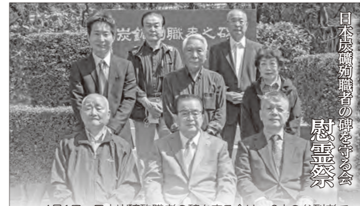
日本炭礦殉職者の碑を守る会 慰霊祭 4月1日、日本炭礦殉職者の碑を守る会は、9人の参加者で慰霊祭を行いました。会員一同で花を手向け、殉職者に哀悼の意を捧げました。 ●日本炭礦殉職者の碑を守る会 (事務局 今岡)

日本にはさまざまな事情により、生まれた家庭で生活できない子どもが約4万2千人いるといわれています。 私たち「福岡県里親支援機関リンク」では、愛情深く子どもの育ちに寄り添うことができる「養育里親」を必要としています。「里親ってなんだろう?」という質問からでも構いません。気軽に問い合わせてください。 ●問い合わせ 福岡県里親支援機関リンク(岡垣町海老津) ☎282-0001