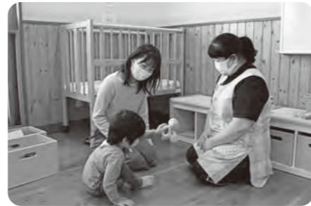
▲広場で子どもを見ながら気軽に相談することもできます