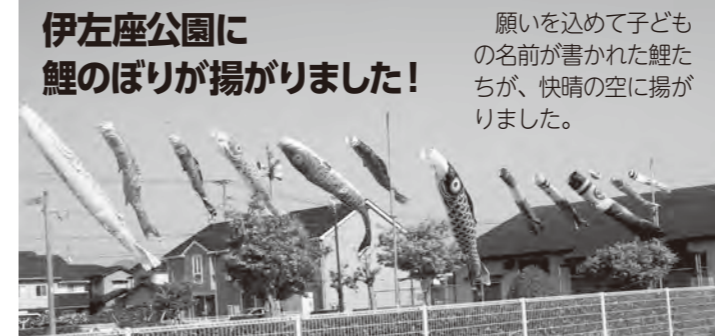
伊左座公園に 鯉のぼりが揚がりました! 願いを込めて子どもの名前が書かれた鯉たちが、快晴の空に揚がりました。