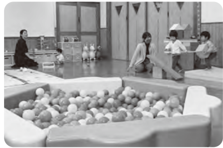
▲子育て広場 奥の引き出しの中にも隠れたおもちゃがいっぱい