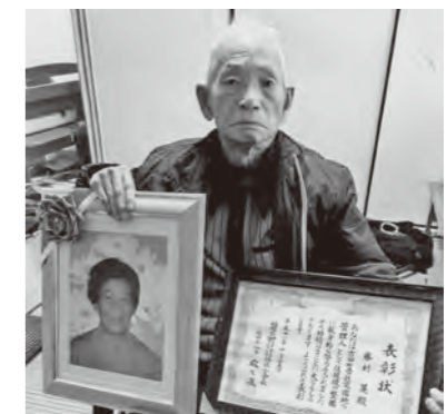
自慢のお父さんへ

サークルの会員募集や講座の案内、地域の出来事などを投稿してください。ここは、読者の皆さんからの記事で作られるページです。 ●問い合わせ 役場広報係 ☎201-4321