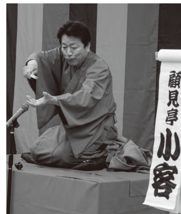
落語で楽しむ春のひととき 水巻ぎんどん寄席

下二地区の南部公民館周辺では、午前8時すぎから近所の人たちが集まり、ふれあい広場や道路脇などのごみ拾いや雑草取りを実施。清掃をしている人たちは、「環境美化の日がずっと中止になって寂しかった。久しぶりにみんなで清掃ができてうれしいです」と話していました。清掃活動で町がきれいになり、地域の絆も深まった日となりました。