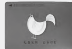
▲プリペイドカード

●持ってくるもの 未使用分のプリペイドカード、本人確認書類(マイナンバーカード、運転免許証、健康保険証など)