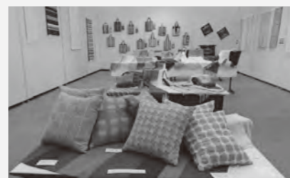
▲12月6日～11日手織展の様子

織り姫は、水巻町染工房の織り機で講師指導のもと、染めと織りを学ぶサークルです。現在楽しく活動しています。私たちが一緒に手織りを楽しみませんか。