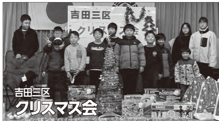
吉田三区クリスマス会

12月18日、吉田三区の子ども会がクリスマス会を開催しました。ビンゴでは、エアホッケー、キャンピングチェア、サッカーゲームなどの豪華景品がプレゼント。袋いっぱいのお菓子ももらえて、笑顔いっぱい楽しい時間になりました。皆さんも子ども会に参加しませんか。 ●吉田三区子ども会