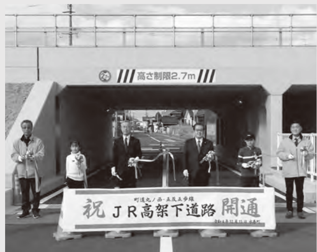
▲開通式典テープカット