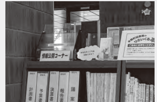
▲情報公開コーナー