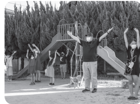
▲中央区のラジオ体操

町には現在 31 の自治区があり、自治区では、子ども会や老人会、清掃活動、防犯活動など個人や家族だけでは解決できない地域の課題に取り組んでいます。また、大規模災害など、いざというときに頼りになる「地域の絆づくり」のため、近所の皆さんとの交流を深めるための親睦行事も行っていきます。自治区の代表者が区長です。区長は地域のリーダーとして自治区と行政のパイプ役を務めるなど、住みよい町づくりのために活躍しています。