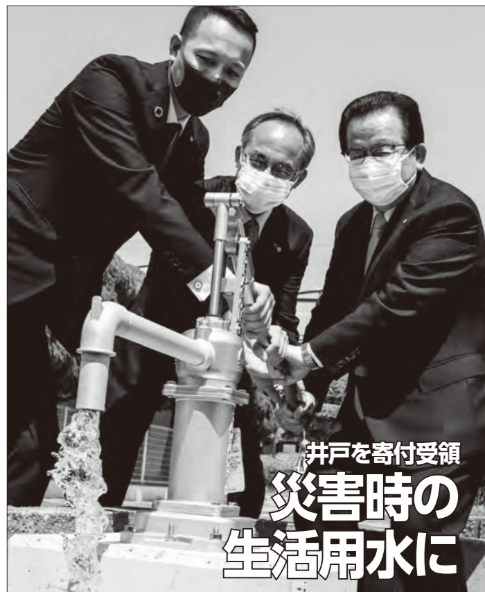
井戸を寄付受領 災害時の 生活用水に

ワンコとの楽しい暮らし方、この4日間で見つけてみませんか。 ●講義 ●とき 6月8日(水)午後1時30分~2時間 ●ところ 宗像・遠賀保健福祉環境事務所遠賀分庁舎(吉田西)