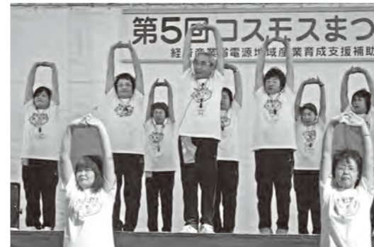
●すまいる*すまいる 健康体操 第5回から15回連続出演中。 ※写真は第5回。