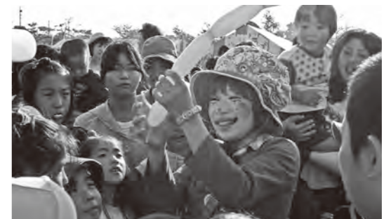
●メロンちゃんのパルーンアートショー 第4回に初登場し、これまでに9回出演。 ※写真は第5回。