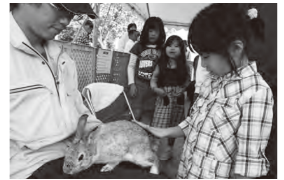
●ふれあい動物園 第4回から16回連続実施中。 ※写真は第10回。