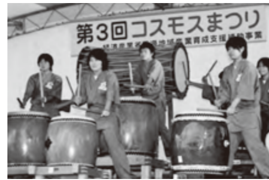
●水巻南中学校 砧太鼓保存会 第3回から17回連続出演中。 ※写真は第3回。