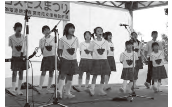
●水巻少年少女合唱団の合唱 第7回から13回連続出演中。 ※写真は第7回。