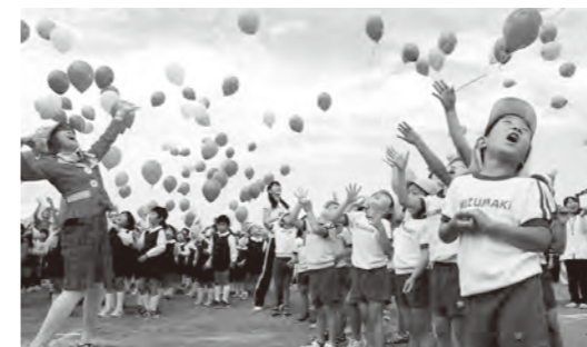
●キッズパーティー 第8回から始まり、12回実施中。 ※写真は第9回。