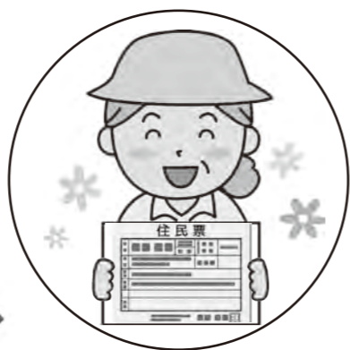
証明書の受け取り