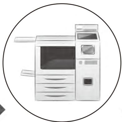
マルチコピー機を使って 発行手続き