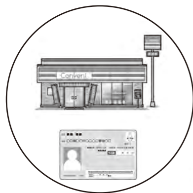
マイナンバーカードを持って コンビニに行く