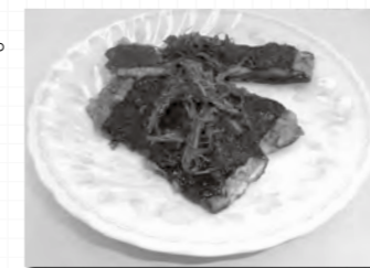
調理:男性料理教室同好会