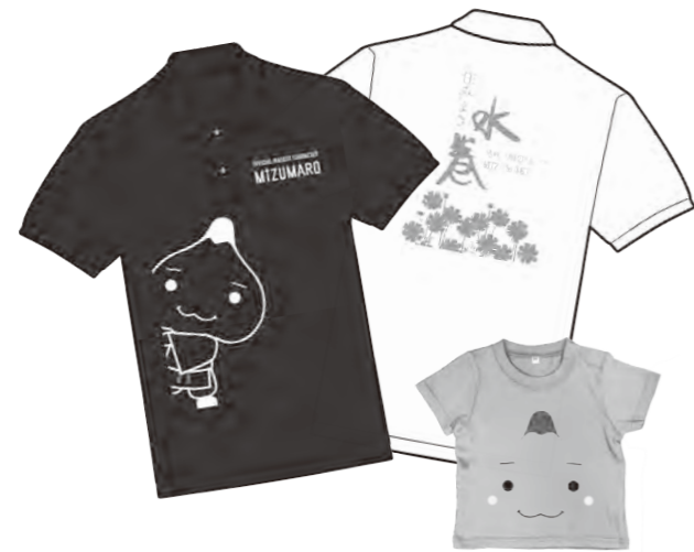
赤ちゃんTシャツ(800円)も販売中

個人や家族で着用する人はもちろん、地域の団体やサークル、会社のユニフォームにぜひ利用してください。 ●販売場所 役場広報係窓口、ICOTTO!MIZUMAKI ※郵送などでの取り扱いはありません。 ●費用 1,000円