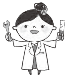
リコちゃん(内閣府「理工チャレンジ」イメージキャラクター)

この度、女子中学生・高校生・大学生の理工系分野への進路選択を促進し、社会全体で応援する気運を高めることを目的に、宇宙飛行士の山崎直子さんなど様々な分野で