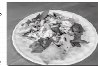
調理:男性料理教室同好会