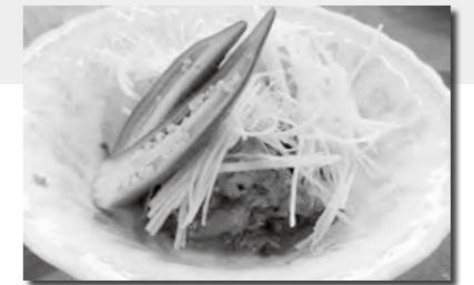
調理:食生活改善推進会

一口メモ 魚の缶詰、特に青魚に含まれるEPA、DHAは血液をサラサラにしてくれる以外に、インスリンの分泌をよくすることが分かってきました。体に魚油が入ってくるとGLP-1が分泌されます。このGLP-1は糖尿病の治療薬としても使われています。また、食欲を抑えてくれる働きもあります。