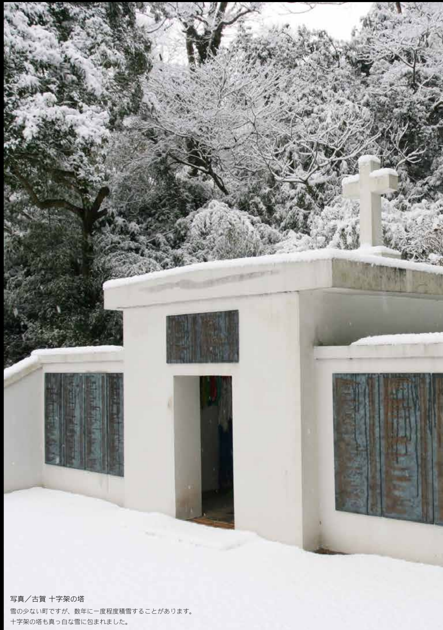
十字架の塔 雪の少ない町ですが、数年に一度程度積雪することがあります。十字架の塔も真っ白な雪に包まれました。