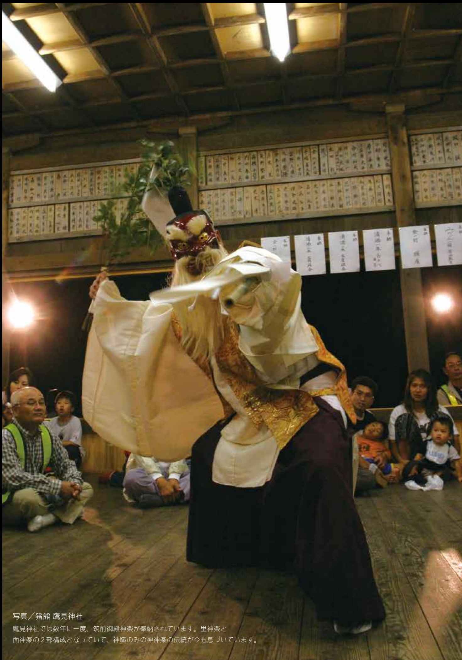
鷹見神社

鷹見神社では数年一度、筑前御殿神楽が奉納されています。里神楽と面神楽の2部構成となっていて、神職のみの神神楽の伝統が今も息づいています。