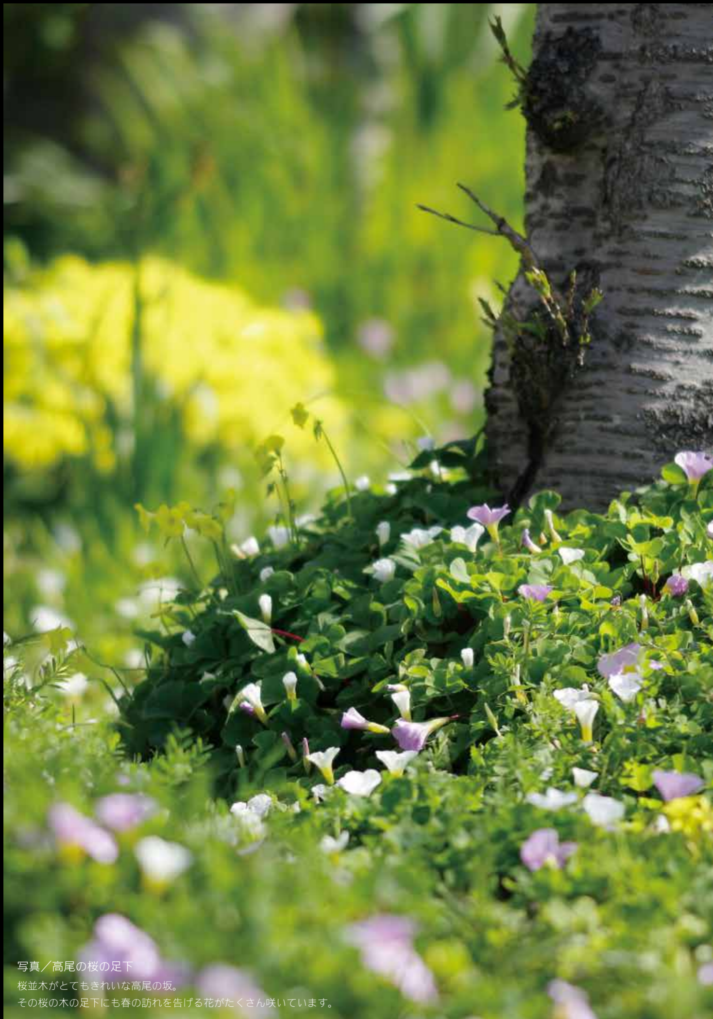
写真／高尾の桜の足下 桜並木がとてもきれいな高尾の坂。 その桜の木の足下にも春の訪れを告げる花がたくさん咲いています。