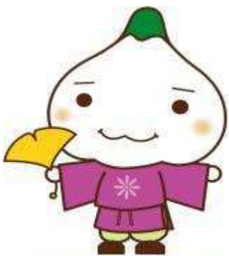
水巻町公式マスコットキャラクター みずまろ