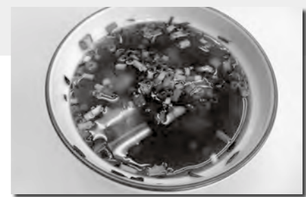
調理:食生活改善推進会