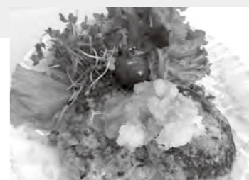
調理：食生活改善推進会