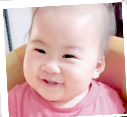
吉田東 たつかわ つもぎ 紡絆ちゃん 29年9月17日生まれ