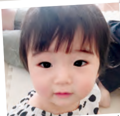
机 みながわ かいり 海璃ちゃん 29年9月9日生まれ