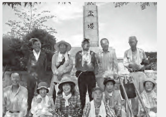
8月7日、水巻町遺族会の12人が集まり、頃末小学校のグラウンド横に建つ戦没者慰霊塔の清掃活動を行い、きれいになった戦没者慰霊塔の前で記念撮影を行いました。