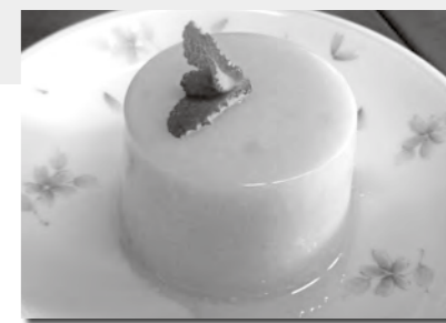
調理：食生活改善推進会