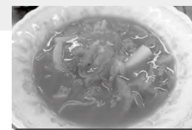
調理:食生活改善推進会