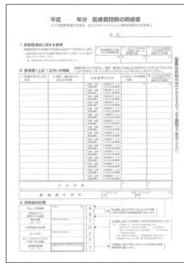
新しい医療費控除の明細書 ←

平成 29 年分の確定申告から、医療費控除の明細書が変わります。平成 28 年分まで使用していた、町様式の明細書は使えなくなりますので注意してください。新しい様式は、役場住民税係窓口、若松税務署窓口、町ホームページなどで入手できます。