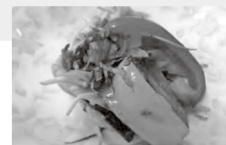
調理:食生活改善推進会