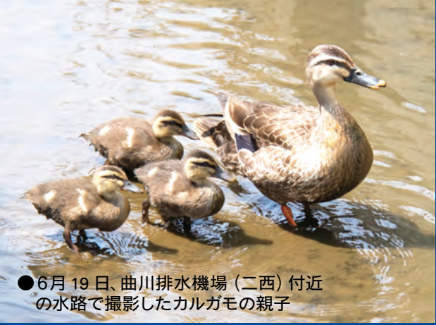
●6月19日、曲川排水機場(二西)付近の水路で撮影したカルガモの親子