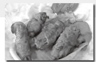
調理:男性料理同好会シニアMC

作り方 ①豚肉は1枚ずつ広げ、縦に2~3等分にし、細長い帯状にする。ショウガ汁を振り、手でもみ込むようにしてよく絡める。 ②ニンジン皮をむいて6cm長さの棒状に、サヤインゲン筋を取って6cm長さに切り、下ゆでする。 ③①を広げ、②を数本ずつ芯にして巻く。 ④フライパンに油を熱し、③の巻き終わりを下にして、転がしながら焼く。 ⑤豚肉に焼き色が付いたら、濃口しょうゆ、みりん、酒を加えて絡める。焦がさないように火加減に注意しながら、照りよく仕上げる。 ⑥サラダ菜を皿に敷き、8等分のくし型切りにしたトマトと一緒に⑤を盛り付ける。