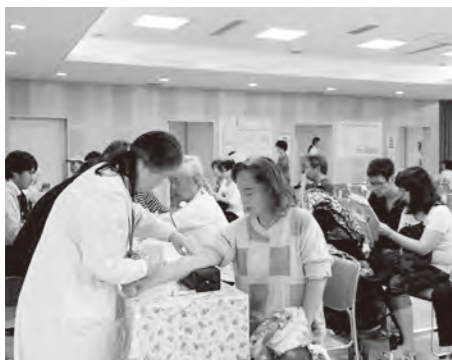
【過去5年の健診受診者と高血圧の人の割合】