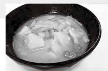
調理：食生活改善推進会