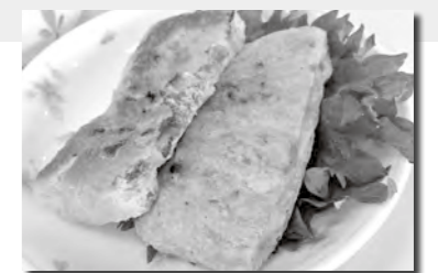
調理: 食生活改善推進会