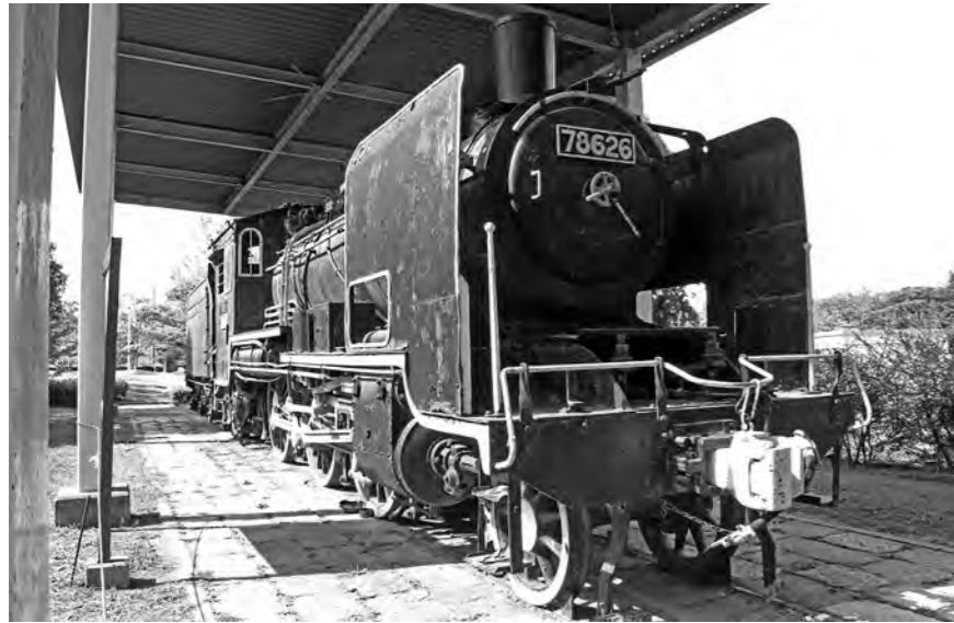
上) 遠賀川駅を発着していた8620形の蒸気機関車。活躍していた当時の姿のまま遠賀総合運動公園に展示されています。

石炭運搬の役割を終えた後も、通勤や通学に利用され、新幹線建設のための資材運搬用の路線としても活躍しました。今でも、遠賀川駅付近では、ノスタルジックな姿を残す廃線跡を見ることが出来ます。