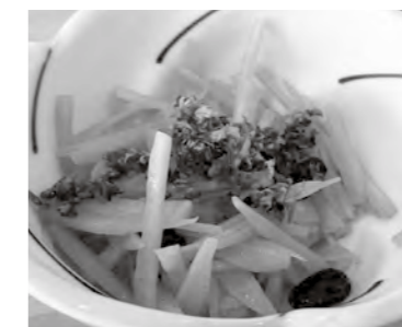
調理：食生活改善推進会