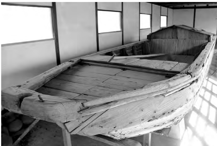
上) 芦屋町中央公民館に展示されている現存する川ひらた。「ひらた船」という名称で県指定文化財になっています。

明治時代になり、石炭産産業が発達すると、遠賀川、堀川流域を行き交う川ひらたはますます増えました。明治30年ごろには遠賀川流域の川ひらたは約7000艘を数え、そのうち半数以上が遠賀郡内の川ひらたでした。その中でも、芦屋町の川ひらたは最も多くを占めていました。その後、石炭輸送の役割は、大量に早く輸送ができる鉄道に、徐々に移っていくものの、川ひらたでの輸送も昭和時代初期まで続きました。現存する川ひらたは2艘だけだといわれ、芦屋町中央公民館と県立折尾高校（八幡西区大膳）に1艘ずつ保存されています。