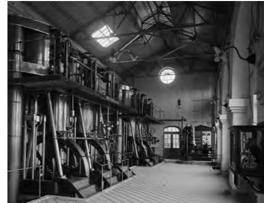
上) 新日鐵住金(株)八幡製鐵所まで、毎日12万トンの水を送っている鉄管道路。 下) ヘイソーン・デビー社製の蒸気エンジンポンプ。ポンプの高さは地上5m、地下2mにもなります。 左) 世界文化遺産に登録された構成資産の一つ、遠賀川水源地ポンプ室。

鉄鋼業に欠かせない 「水」を送るポンプ室 遠賀川水源地ポンプ室は、官営八幡製鐵所の施設として、明治43(1910)年に建設されました。 当時、製鐵所の鉄鋼業は国が進める近代化の柱として重要視され、鉄鋼の生産量を2倍にする計画がありました。この計画に欠かせないのが「水」。その水を遠賀川から製鐵所まで供給し続けているのが、この施設です。