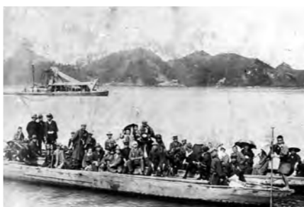
左) 川ひらたを改造した船に乗り、芦屋見物と船遊びをする香月町（現・八幡西区香月）の貝島大辻炭坑の職員。