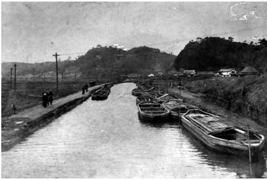
上) 明治時代中期の水巻町吉田付近。堀川に多くの川ひらたが付けられている。

江戸時代に遠賀川と洞海湾をつないだ堀川。その流れは、日本の重化学工業の発展に貢献したのです。