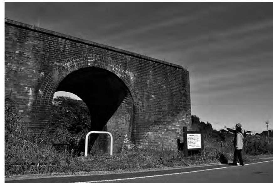
上) 美しいアーチを描く、レンガ造りの橋梁（岡垣町指定文化財）。 左) 赤レンガアーチに代わり現在も鉄道の往來を支えるレンガ造りのトンネル。

このころの橋梁には、簡単に手に入り、外観が美しい素材として、レンガが多く使われていました。道路と立体交差になっていたレンガ造りの美しいアーチは、今も明治文化の面影を残しています。