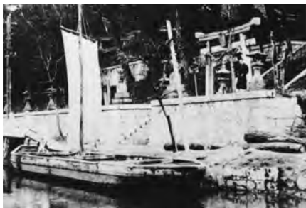
左) 大正時代の河守神社前(水巻町吉田東)の堀川。川ひらたが帆を揚げるのは珍しい。