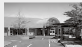
水巻町の図書館です。コミュニケーションの場として多くの町民から利用され、その蔵書数は約15万点。平成27年に町が行った中学生へのアンケートでは、町で自慢できるものとして上位にあげられています。