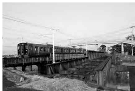
左) 手前の橋梁が室木線跡、奥は鹿児島本線下り。