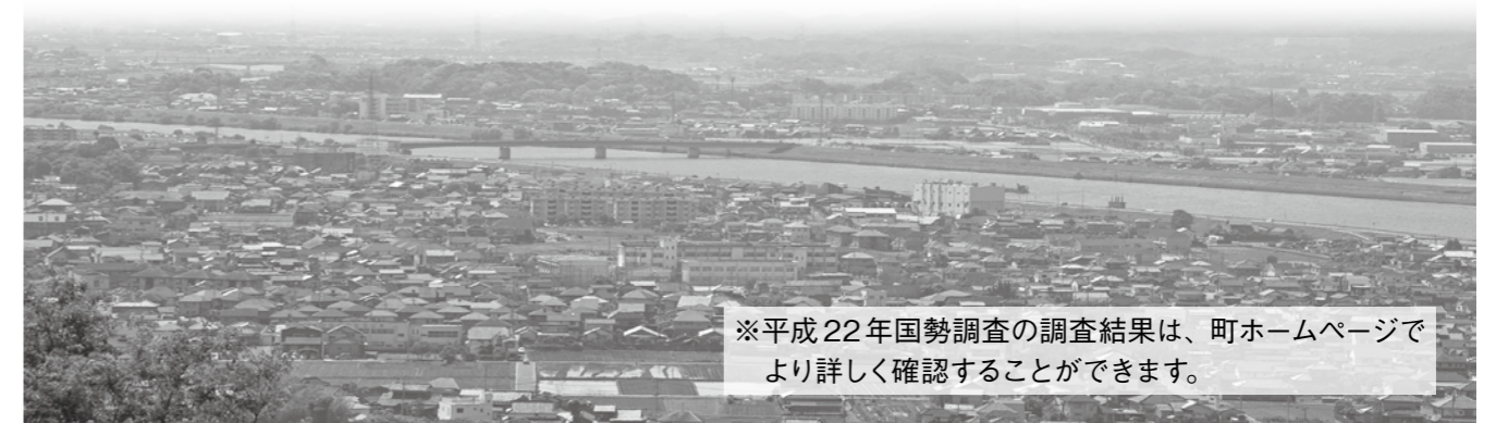
※平成22年国勢調査の調査結果は、町ホームページでより詳しく確認することができます。

いることやJRの駅が2つあることなど交通の利便性の良さを考えて、集合住宅を整備している影響が大きいと考えられます。平成17年調査と比べると、持ち家の数は各町で少しずつ増加しています。水巻町は民営借家も増加数、増加率ともに他町と比べて群を抜いていることも分かります。