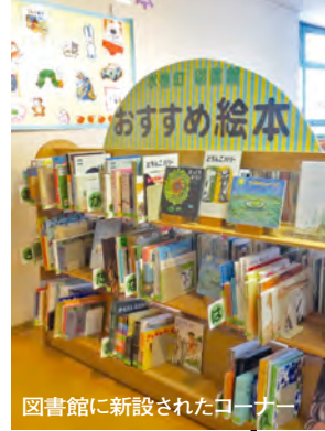
図書館に新設されたコーナー