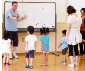
「英語となかよし」の様子