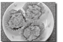
調理：食生活改善推進会