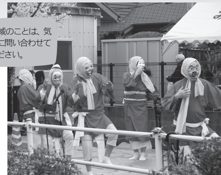
みずほ区のさくらまつり