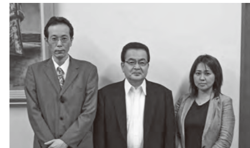
5月1日、町長から県税職員へ徴収業務の委嘱が行われました。

町は福岡県と共同で町税の徴収業務を行っています。催告などに応じない悪質な滞納者には、県税職員の支援を受けながら、共同で財産調査や差押えを行うなど、徴収を強化しています。