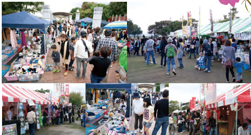
昨年行われたコスモスまつりの出店、リサイクルマーケットの風景

コスモスまつりの出店とリサイクルマーケットを募集します。応募者多数の場合は、実行委員会が抽選で出店者を決めます。 ● とき 10月27日(土)、28日(日) 午前10時30分～午後4時 ● ところ みどりんぱあーく ● 対象 町内に店舗を持っている人または町内に住んでいる人 ● 出店の種類 は自由ですが、競合する場合は調整することがあります。 ● リサイクルマーケット は家庭用品のみの販売です。調理・飲食関係の出店はできません。 ● 募集数 ▽出店 19店舗 ▽リサイクルマーケット 12区画 ● 必要書類 本人の免許証または保険証のコピー ● 町外者 で町内に店舗を持つ人は、店舗の場所が確認できる書類も必要です。