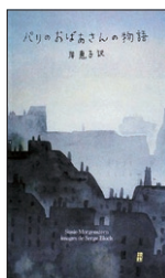
「パリのおばあさんの物語」