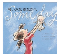
「ちいさなあなたへ」