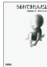
「うまれてきたんだよ」