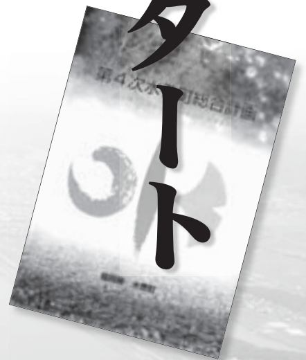
第4次総合計画は役場1階ロビヤ図書館で見ることができます。