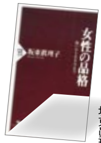
第3位 女性の品格 坂東眞理子