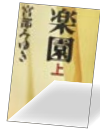
第2位 楽園 宮部みゆき