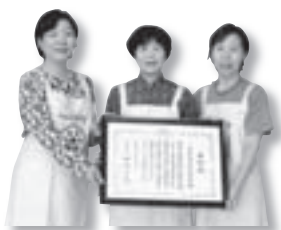
これまでの28年間の活動が評価され、厚生労働大臣表彰を受賞しました。