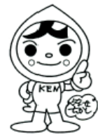
人権イメージキャラクター 「人KENまもる君」

6月1日は人権擁護委員の日です。あなたの街の身近な相談パートナーの人権擁護委員が、家庭内のもめ事や近所とのトラブル、いじめや差別などの相談に応じます。相談は無料で、秘密は厳守します。