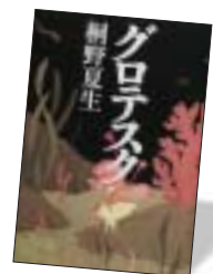
第4位 グロテスク 桐野夏生