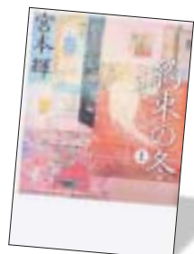
第2位 約束の冬(上・下) 宮本輝