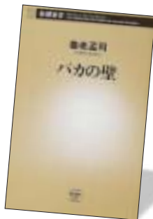
第1位 バカの壁 養老孟司